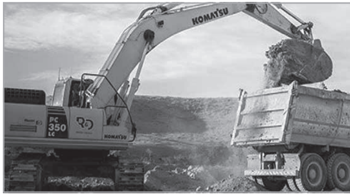
Com capacidade instalada superior a 50 mil toneladas anuais, a unidade tem previsão de entrada em operação para o segundo semestre de 2029

Está em tramitação na Câmara Municipal de Juiz de Fora o projeto de lei 196/2026, que propõe ampliar os casos de isenção no pagamento da Área Azul, sistema de estacionamento rotativo da cidade. Caso o projeto seja aprovado e sancionado, o benefício poderá ser concedido a veículos utilizados por pessoas com deficiência, idosos com 60 anos ou mais, pessoas com mobilidade reduzida permanente, pessoas com doenças incapacitantes que afetem a locomoção e pessoas com TEA. (Tribuna de Minas) https://tribunademinas.com.br/noticias/politica/22-06-2026/proje