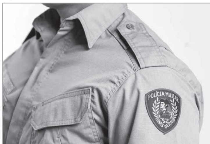
Integrante da Polícia Militar teve o pedido de promoção negado

A Comissão de Promoção de Praças (CPP) da