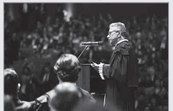
O presidente Vicente de Oliveira Silva ressaltou que qualidade, eficiência, celeridade, inclusão, transparência, inovação, ética e humanização continuarão como pilares das ações da Presidência