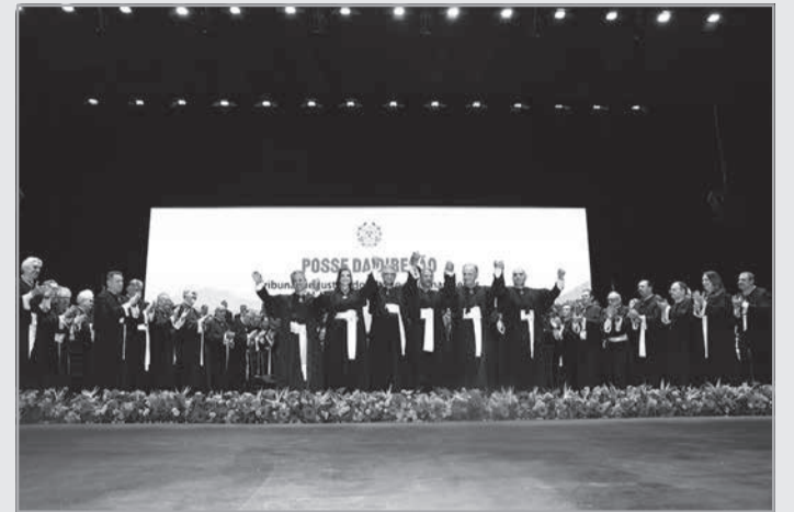
Os membros da Direção do TJMG no biênio 2026-2028 foram empossados no Grande Teatro do Palácio das Artes, nesta quarta-feira (1º/7)