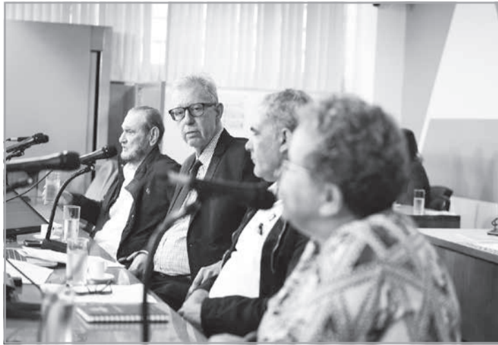
Participantes da audiência pública desabafam sobre transferências forçadas de quase 3 mil funcionários

Para distâncias entre 75 e 150 quilômetros, o auxílio é de R$ 1.621 e, acima