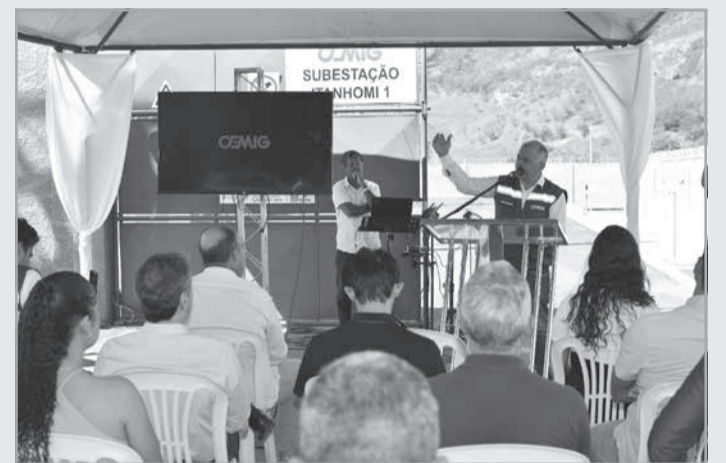
Empreendimento beneficia cerca de 77 mil moradores dos municípios de Itanhomi, Capitão Andrade, Engenheiro Caldas, Tumiritinga, Alvarenga, Inhapim e Tarumirim