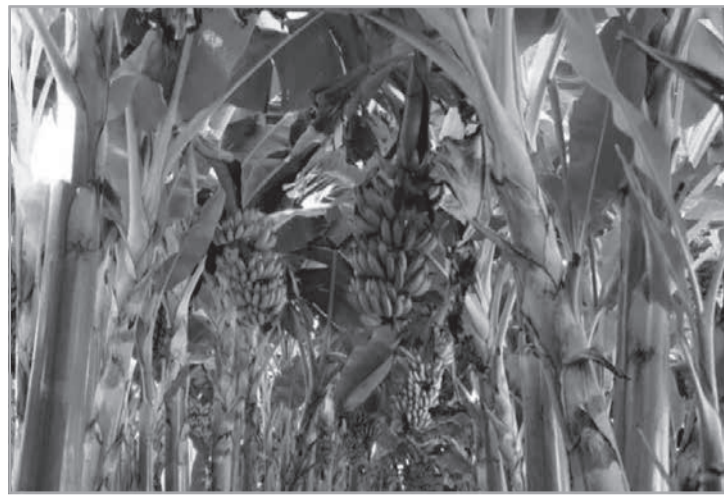
Dados do IBGE mostram liderança da banana e expansão de culturas como tangerina, manga, goiaba, laranja e abacate na região

- Como uma das principais instituições ligadas ao agronegócio e a pecuária leiteira no Leste de Minas, a Coopera-