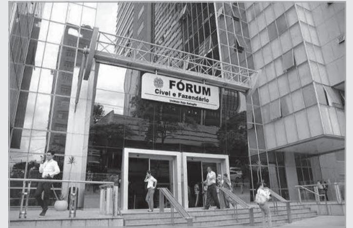
A decisão é da juíza da 17ª Vara Cível da Comarca de Belo Horizonte, Miriam Vaz Chagas

Defesa - Os réus argumentaram que não houve censura ou ato ilícito e que a exclusão da peça na terceira etapa se deu por descum-