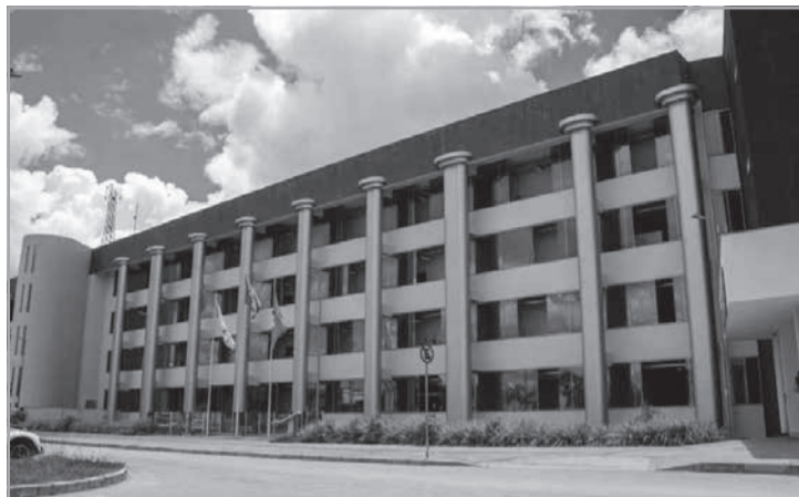
A Prefeitura de Divinópolis que promover uma reforma e diz que ela é necessária para garantir o equilíbrio financeiro e atuarial do regime previdenciário municipal

https://diariotribuna.com.br/?p=34257 Justiça determina planejamento da Romeirovia - A Justiça Federal atendeu a um pedido do Ministério Público Federal (MPF) e